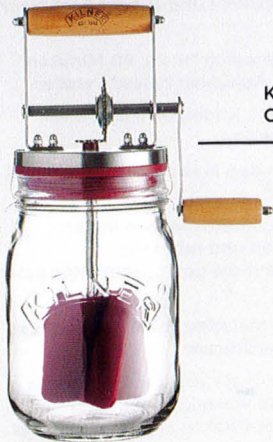
Kilner® Butter Churner